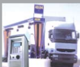
автомат HECFLEET Коммерческие АЗС