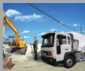
автомат ТА 2331 MOBIL Мобильные АЗС