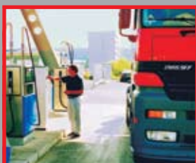
Автомат ТА 2331 Ведомственные АЗС