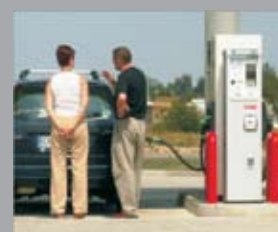
Автомат HECSTAR Коммерческие АЗС